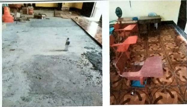
Foto7: MODULO Aula piso ceramico insalado sobre base de concreto.