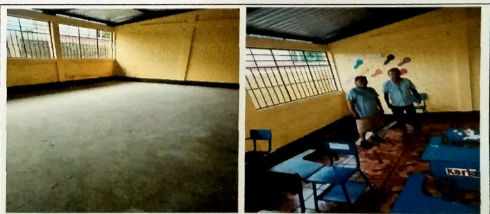
Foto 6: MODULO B aula lateral derecha, se instalo piso ceramico sobre base de concreto.