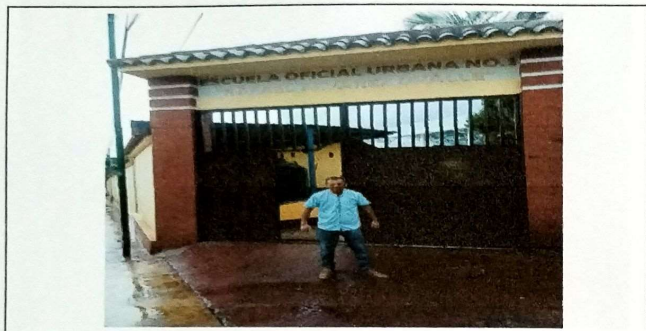
Foto1: Vista Principal de ingreso al centro escolar