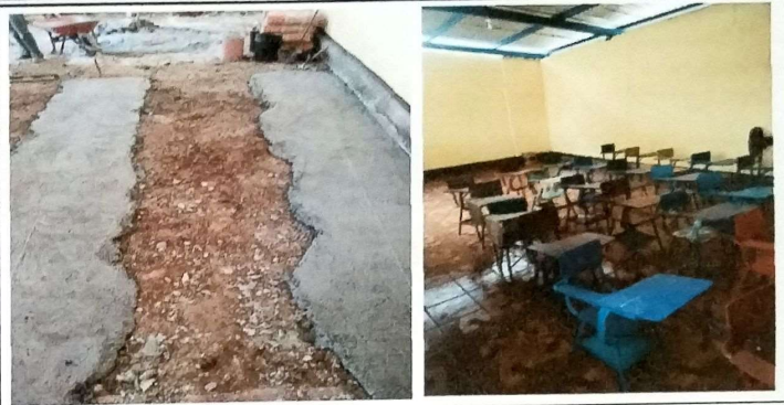
Foto 8: MODULO Aula piso ceramico insalado sobre base de concreto.