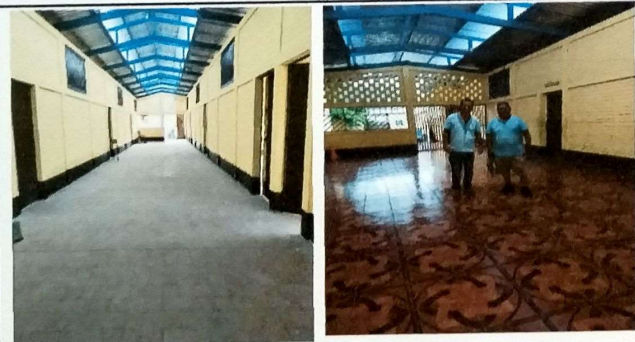
Foto 9: MODULO B corredor central, se instalo piso ceramico sobre base de concreto liso.