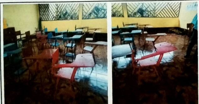
Foto 11: MODULO AULA se instalo piso ceramico sobre base de cemento liquido.