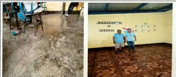
Foto 4: MODULO B Aula lateral derecha se instalo piso ceramico sobre base de cemento liquido.