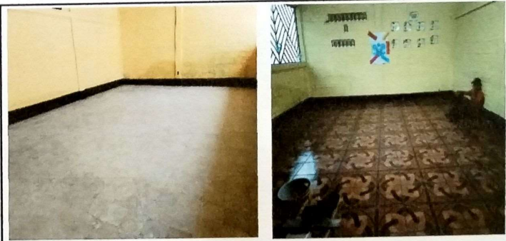
Foto 10: MODULO B Aula lateral derecha se instalo piso sobre base de concreto.