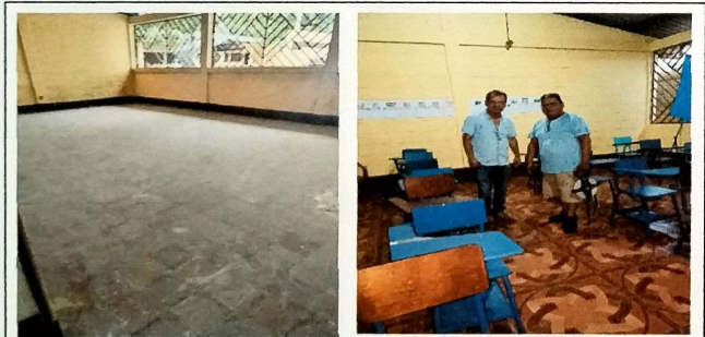
Foto 3: MODULO B aula lateral izquierda, se cambio el piso ceramico.